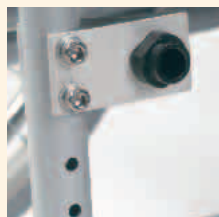
2 Sitzhöhen einstellbar (47 cm und 51 cm); dient auch als Radstandsverlängerung