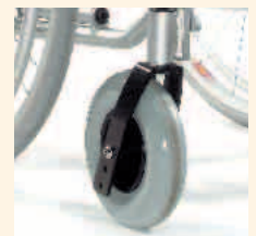
Sitzwinkel einstellbar von 0°, 3°, 6°

Der Breezy Elegance besticht mit einem Optimum an Funktionalität bei größtmöglicher Individualität: Von der niedrigsten Sitzhöhe mit 42 cm, ideal zum Mittrippeln, bis zu 51 cm kann die Sitzhöhe in fünf Stufen individuell auf die Anforderungen des Benutzers angepasst werden. Und das ohne zusätzliche Anbauteile. (Alles mit 24" Antriebsrad und 8" Lenkrad realisierbar)