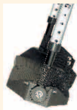
Winkelverstell- bares Fußbrett