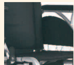
Gepolsterte Sitz- und Rückenbespannung

Der Breezy Entrée beeindruckt mit einer Vielzahl von Einstellmöglichkeiten, die kinderleicht umgesetzt werden können. Der neue Achsadapter ist das Multitalent schlechthin. Nach hinten eingebaut wird er zur integrierten Radstandsverlängerung, durch einfaches Versetzen nach oben kann die Sitzhöhe stufenweise von 47 bis 51 cm variiert werden. Und auch die Armauflage hat es in sich. Durch nach vorne anbauen wird aus der kurzen, festen Armauflage eine lange Auflage und genauso einfach funktioniert es auch bei der höhenverstellbaren Armlehne. Einfach seitenverkehrt einbauen und schon verwandelt sich die kurze Armauflage in eine lange.